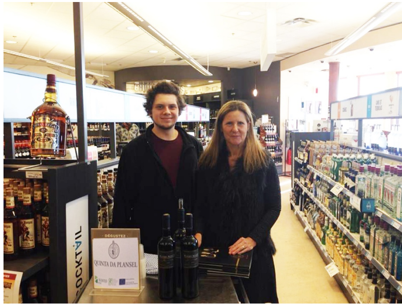
Feira de vinho Canadá / Canada Wine Fair