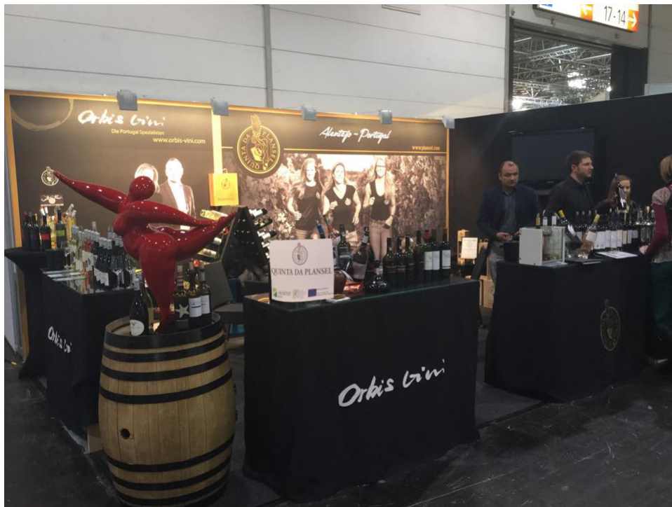
Feira na Alemanha Prowein / Fair in Germany Prowein