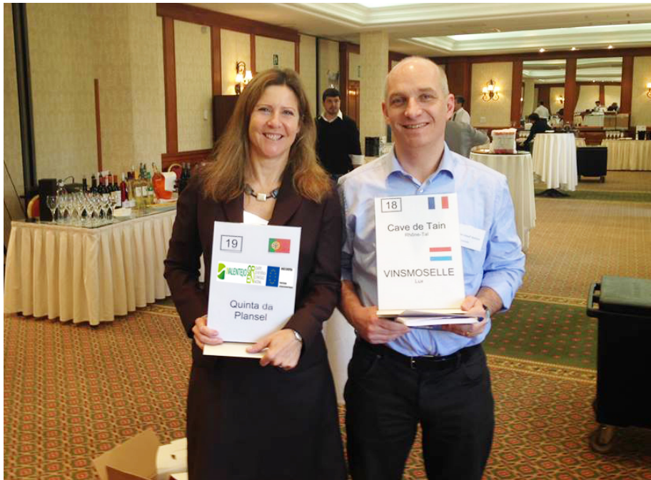
Feira em Mallorca / Mallorca Fair